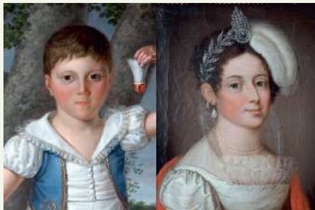
Prins Frederik ble kalt Fritz. Han var bare to år da foreldrene ble skilt.

En som skulle bli konge, måtte kunne mye. Hver dag måtte han sitte lenge stille og lære alt mulig. Lese var han alt ganske flink til, skrive var vanskeligere. Enda vanskeligere var det å snakke fransk, men det språket måtte en konge kunne. Han kjente igjen ganske mange ord når læreren sa dem. Han skulle nok få det til!