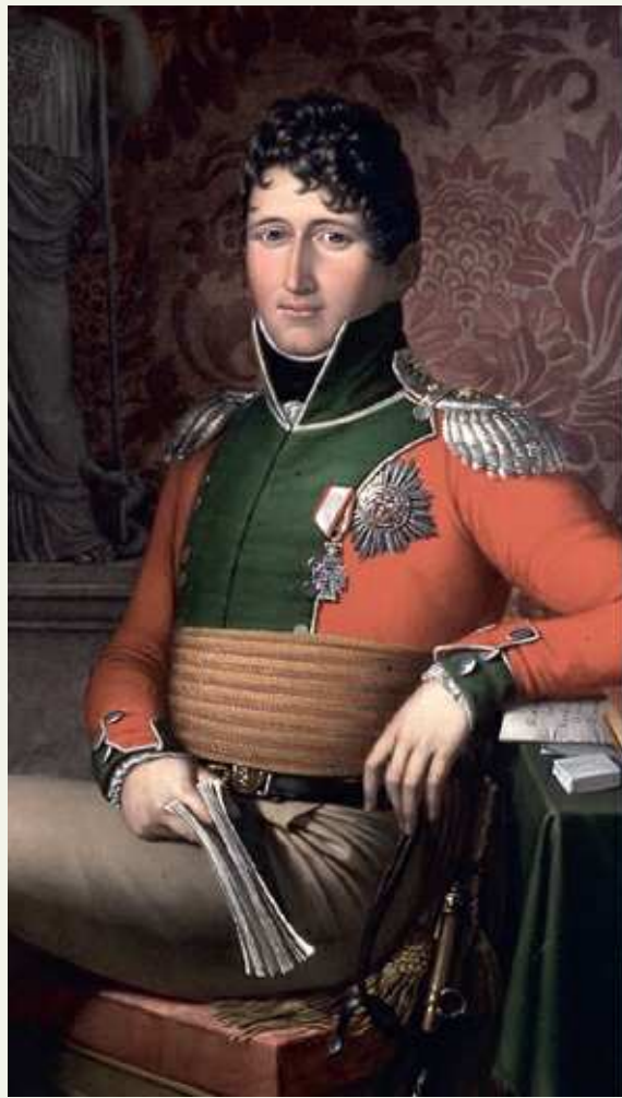
Prins Christian Frederik, 27 år gammel, i dansk militæruniform.